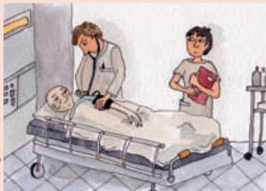
TABLEAU 1. Accueil d'une personne ayant subi un accident vasculaire cérébral (situation aiguë)

■ La formalisation des savoirs autour des situations professionnelles clés (tableau 1) devient un excellent outil d'apprentissage lorsque le formateur initie l'étudiant à mobiliser l'ensemble des savoirs à partir de situations cliniques singulières ; il favorise ainsi la transformation du savoir en connaissance et l'étudiant peut réutiliser ces derniers dans une autre situation singulière.